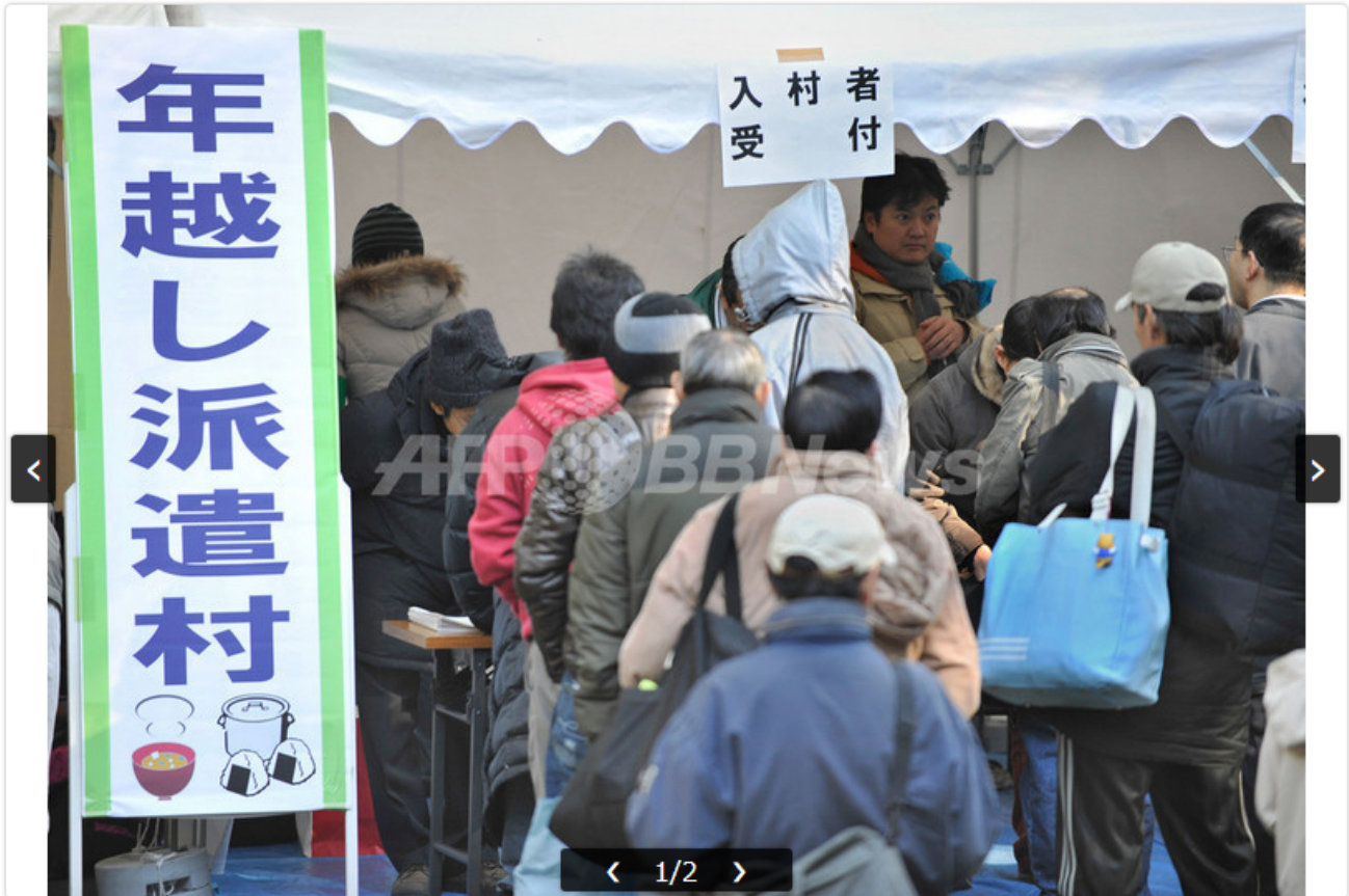
都内の日比谷公園に年末年始の失業者支援を目的に開設された「年越し派遣村」で、登録の列に並ぶ人びと（2008年12月31日撮影）。

2008年12月31日 18:57 発信地：東京 [ アジア・オセアニア, 東京 ]